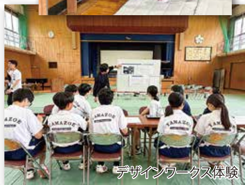
デザインワークス体験