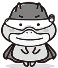
労働基準局 広報キャラクター 「たしかめたん」