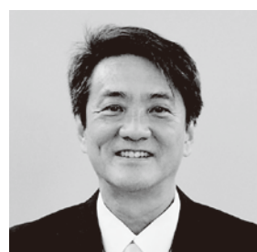
名張市長 北川 裕之

名張市は、渓谷美で名高い赤目四十八滝を擁し、2024年には「渓谷の自然とつながる水族館」と