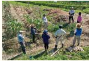
学びのあとの分かち合い (大人組)