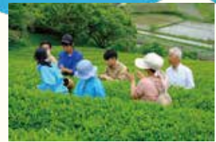
山添特産の紅茶づくりを体験します