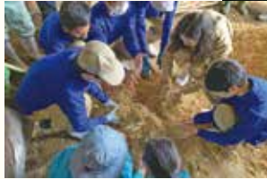
微生物をいかに堆肥づくりを学びます