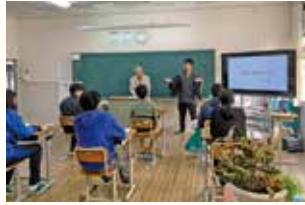
山添の文化や歴史を学びます