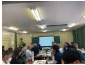
山添村の持続可能な未来を考える会議