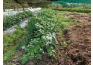
土地にある野菜を検証しています