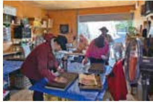
課外授業： 実際の農家に行って作業を体験