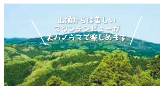
山頂からは美しいマウンテンビューが大パノラマで楽しめます

こうのやま なだらかなスロープを見せる神野山(標高618.8m)は、県指定名勝・県立月ヶ瀬神野山自然公園に指定されています。 山頂からは360度のパノラマが広がり、春にはつつじが咲き誇り緑と紅のコントラストが山を彩り、また新茶の時期には茶畑の新芽が青空に映えます。紅葉が山一面を覆う秋が過ぎると、うすらと雪化粧します。