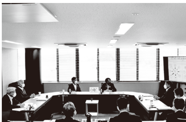
推進協議会の様子

* Plan (計画) → Do (実行) → Check (評価) → Action (改善) の4段階を繰り返して、継続的に業務を改善する方法