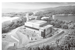
エネルギー回収型処理施設完成イメージ図