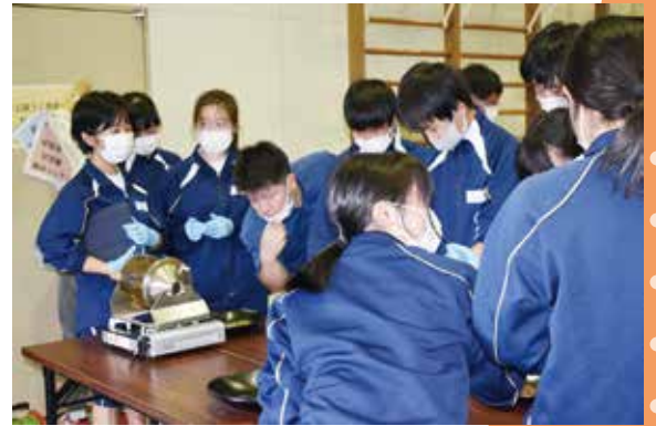
▶ほうじ茶焙煎体験