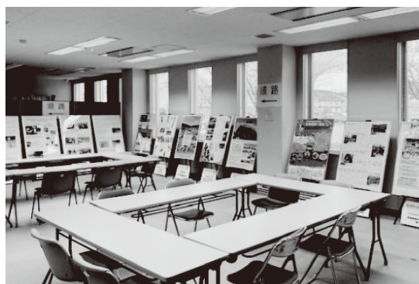
▲ 昨年の市民活動支援センターパネル展の様子