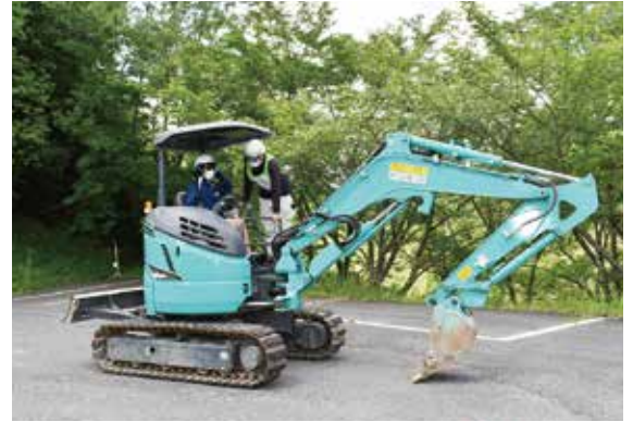
▶パワーショベル体験