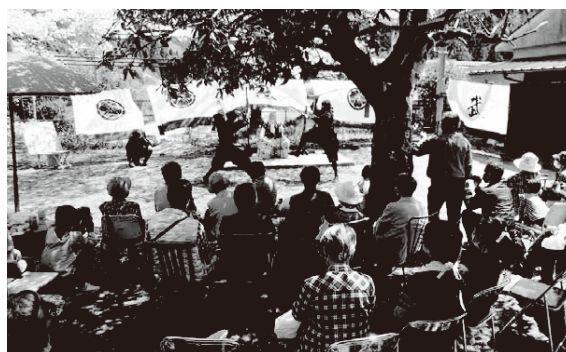
毎年4月初旬の「花まつり」の様子