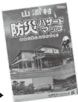
山添村防災 ハザードマップ▶

風水害は、気象情報である程度の予測が可能です。避難の準備は、雨や風が強くなってからでは間に合いません。平常時に災害を想定した対策をしておくことが重要です。