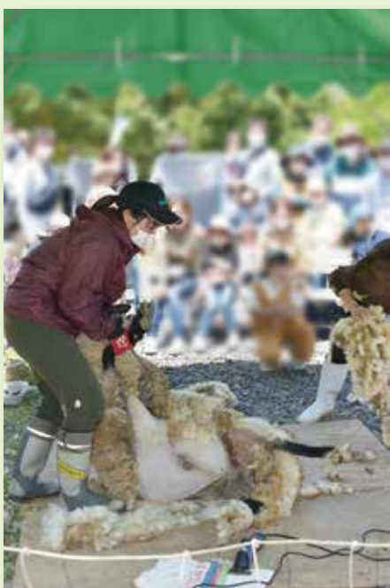
◀ひつじの毛刈りショー

4月29日～5月8日に神野山で「神野山フェス2022」が開催されました。ひつじの毛刈りショーや木工教室などさまざまなイベントが開かれました。当日は天候に恵まれ、来場者も多く見られました。