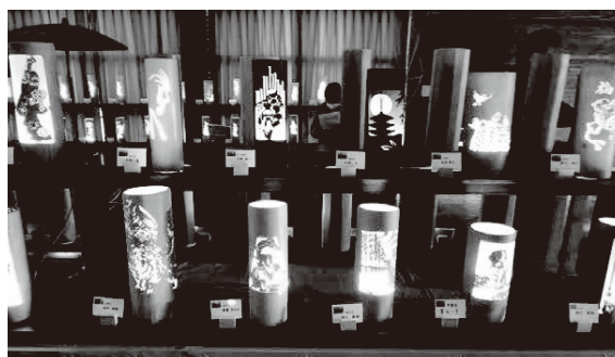
「竹工房教室」受講生の作品展を開催

また、地域内外の多様な皆さんと「共創」して、持続可能な特長ある地域づくりをめざしています。具体的には、自然を満喫できるキャンプ場の新設、「阿弥陀如来立像」「ひろせ山城」をベースとした歴史探索ハイキングコースの整備を、いつか叶えたい夢として計画しています。実現に向けて一緒に活動できるメンバーを募集しています。