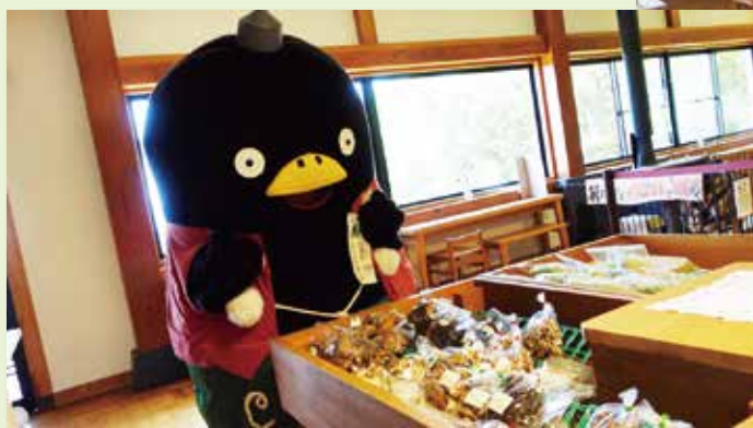
◀みどり屋 春の野菜フェア