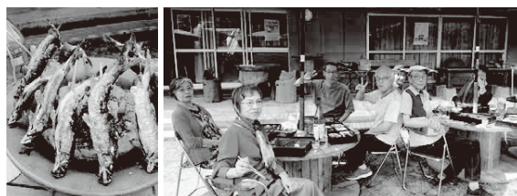
自然にふれあいながら、鮎料理を堪能するグループ