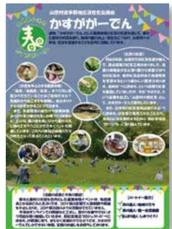
〈波多野地区活性化協議会〉