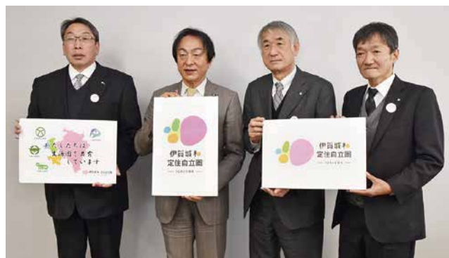
新しいロゴマークをPRする4市町村長 ※写真撮影時のみマスクを外しています。