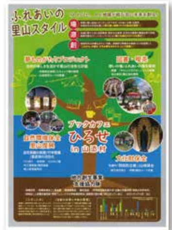
〈ブックカフェ ひろせ〉

表彰式では、「ブックカフェひろせ」が271票を獲得し見事グランプリに輝きました。