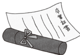
▲絵：マッケンジー先生