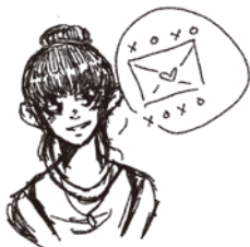
▲絵：マッケンジー先生