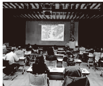
メイン会場 (ハイトピア伊賀)

参加者は、ムラの出入り口などに大きな藁細工を吊るすカンジョウナワ行事から、木津川沿川地域をはじめ全国に同様の行事がある理由や行事に込められた思いを学びました。