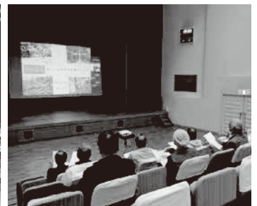
サブ会場 (やまなみホール)