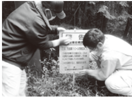
環境パトロールの様子