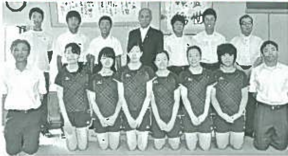
村長及び教育長へ結果報告のため表敬訪問されました。