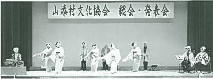
山添村文化協会 総会・発表会