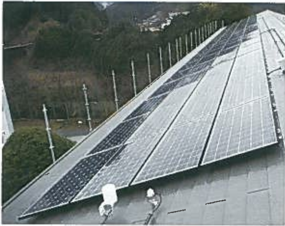
ズラリとならんだ太陽光パネル

山添中学校の屋根・外装などの改修工事が完了しました。 屋根には164枚の太陽光発電パネルを設置しており、これより学校での年間電気使用量の約45%をまかなえる予定です。