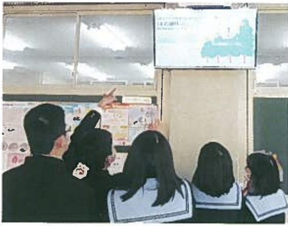
発電量を示すパネル「ワー発電している!」