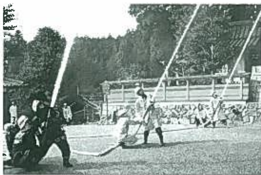
山添消防署員と消防隊による一斉放水

「境内で火災が発生した」想定で、初期消火、消防署へ連絡、重要物品の搬出などを的確に行い、天神社消防隊と、到着した山添消防署員による一斉放水が本番さながらに行われました。