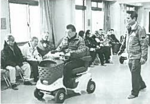
時速6km「思っていたより速いな」(時速6km以下で走行するように設定されています)

試乗を終えて、「車いすからはみ出るほど多くの荷物を積んで運転している方がいて、とても危険に思いました。」などを真剣に話し合われていました。