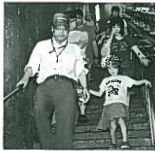
長い階段を下り 涼しいダム内部へ

7月28日、日ごろ目にすることが出来ないダム内部の見学と水生昆虫観察などが行われました。