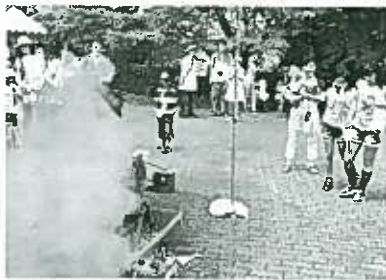
ポン菓子の爆発音に みんなビックリ

また、警察航空隊のヘリコプターによる水難防止広報飛行、消防車の放水演習、木工教室、自転車スラローム、屋台などたくさんさんの企画が盛りこまれていました。