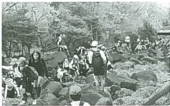
高学年は、下級生を気遣いながら鍋倉溪をのぼりました。

待ちに待った全校遠足。子どもたちは1年生から6年生の縦割り班（異年齢集団）で、鍋倉溪をのぼり神野山の山頂へ向かいました。