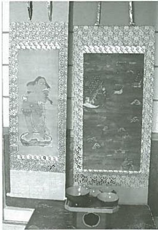
赤童子図 宮曼陀羅 漆器

宮曼陀羅は、奈良春日大社の社頭風景を描いたもので、本紙を絹本とし、社殿の千木など一部には金箔を用いています。後世の補彩箇所や画絹の一部には欠失する部分もありますが、概ね当初に近い状態と思われます。現状の表具は近年のもので、特に作者・制作の経緯などを記した銘文はありませんが、収納箱一合が付属しており、山辺郡勝原庄の春日講本尊の旨の墨書銘と元龜2年(1571)の記年銘があり、当時から本尊とされていたことが分かります。