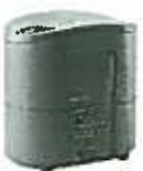
KS-32G 平成5年に製造販売