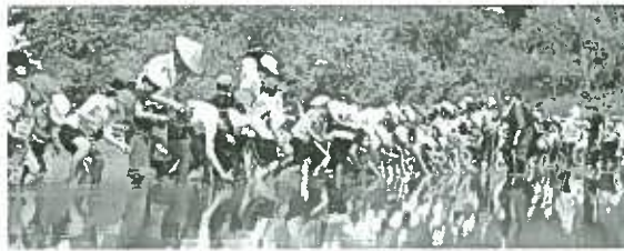
一斉に田んぼに入り印の付いた縄に合わせて田植えの始まり

最後に6年生が原爆苗を植え1時間程で田植えは終わりました。 うまく育つといいですね。