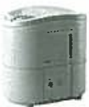
KS-31W 平成5年に製造販売