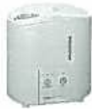
KS-300W 平成10年に製造販売